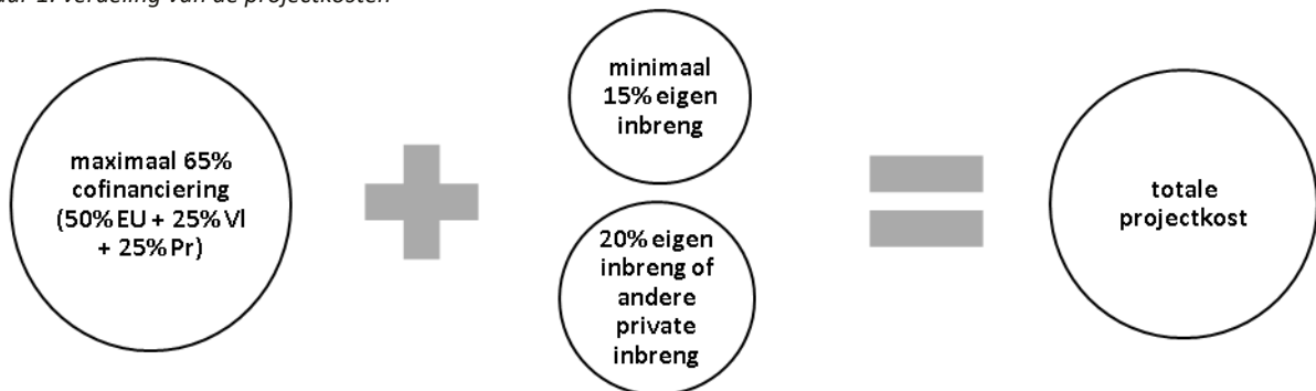
Figuur 1: verdeling van de projectkosten

De promotor moet dus nog 35% cofinanciering vinden, waarvan minimaal 15% eigen inbreng is van de promotor en de copromotoren samen. De overige 20% kan ingevuld worden door andere subsidies van de provincie of subsidies van de gemeente, sponsoring, partners ... De steun kan niet gecombineerd worden met andere Europese of Vlaamse subsidies voor dezelfde projectkosten. De middelen van het plattelandsfonds daarentegen zijn trekkingsrechten en worden beschouwd als eigen gemeentelijke middelen. Daardoor kunnen ze wel gecombineerd worden met deze subsidie. Gegenerende inkomsten uit het project worden overigens niet beschouwd als eigen inbreng van de promotor.